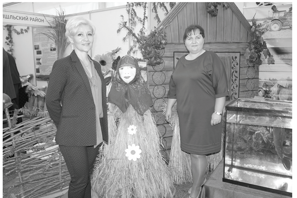
Гостеприимные хозяйки думиничской экспозиции: «Добро пожаловать!»

Но «гвоздем программы» безусловно стал потешный енот-полоскун. Вокруг его клетки постоянно толпились малыши. Енот охотно просовывал через решетку