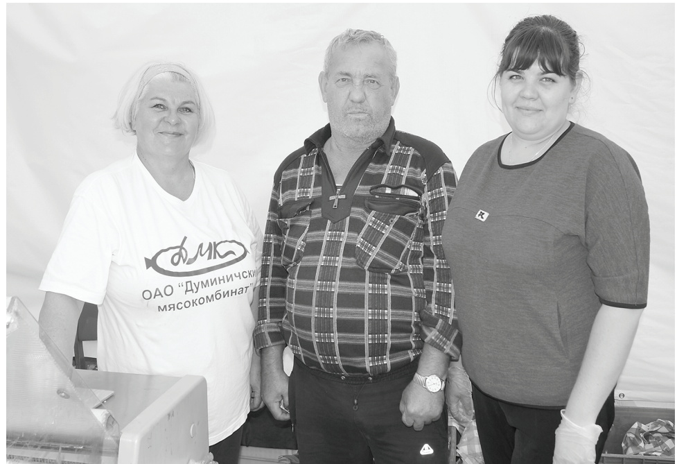
Боевая бригада «ДМК».

свои лапки и счастливые дети «здоровались за руку» с ним.