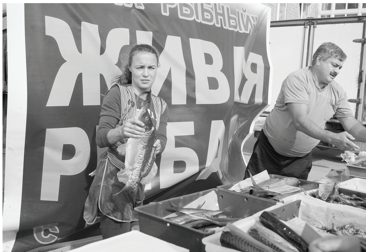
СПК «Рыбный» - традиционный участник областной выставки-ярмарки. Торговля шла бойко.